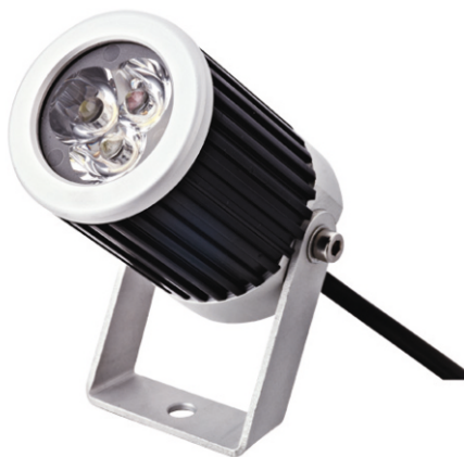
Spot LED type SPL45, 12 VDC