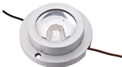
Spot LED type ABS38C, 3.7 VDC