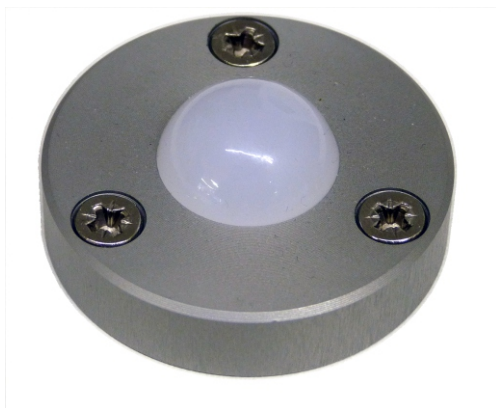
Lampe LED type ABL45WSF, 24 VDC