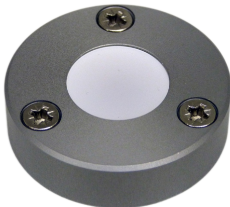
Lampe LED type ABL45SL, 24 VDC