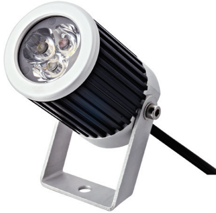
SPL45, 12 VDC