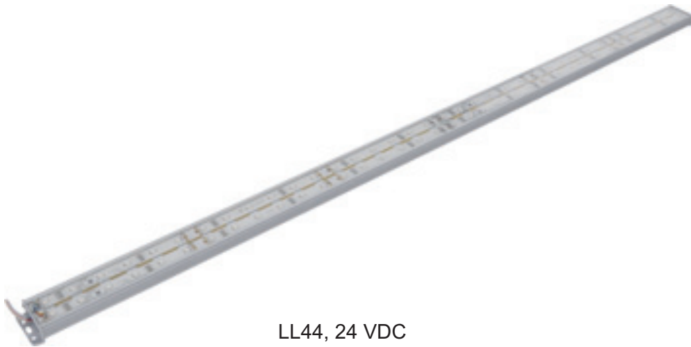
LL44, 24 VDC