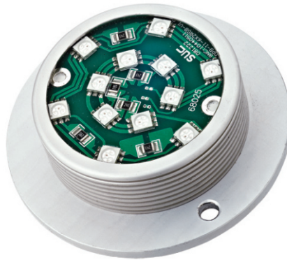
ABL75, 24 VDC