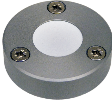
ABL45SL, 24 VDC